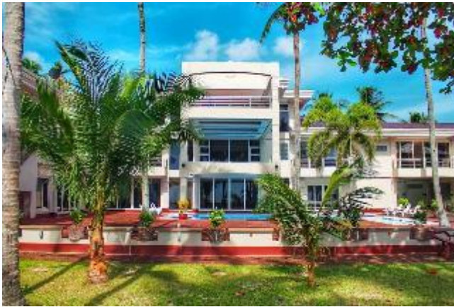
巴拉望海岸度假村 / 前1晚 Costa Palawan Resort

度假村面朝海濱，提供室外游泳池、健身房和花園。設施有餐廳及覆蓋各處免費 WiFi。客房均配有空調、電視、冰箱、坐浴盆及免費洗浴用品。