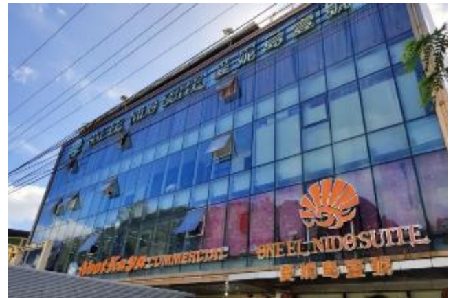
愛妮島壹號 / 後3晚 One El Nido Suite

位於愛妮島，提供餐廳及免費WiFi；客房設有空調、陽台、電視、保險箱和衣櫃。浴室配有坐浴盆和冷熱水花灑淋浴、洗浴用品、毛巾和床單。