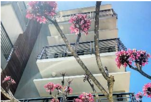
珊瑚崖酒店 / 後3晚 Coral Cliff Hotel

飯店提供池畔酒吧和咖啡廳等設施服務，離巴拉望NCCC購物中心和普林塞薩港市海濱長廊很近。客房有免費無線上網和保險箱等設施。