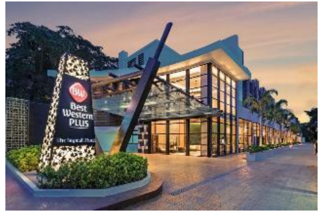
貝斯特韋斯特及艾維沃飯店 / 前1晚 Best Western Plus The Ivywall Hotel

度假村面朝海濱，提供室外游泳池、健身房和花園。設施有餐廳及覆蓋各處免費 WiFi。客房均配有空調、電視、冰箱、坐浴盆及免費洗浴用品。